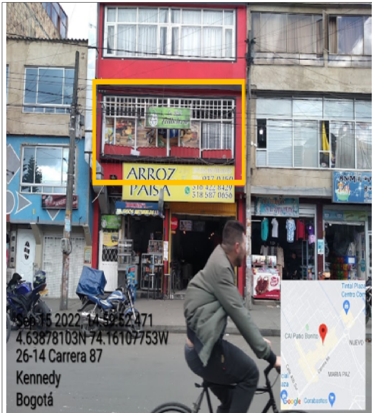
Vista panorámica del predio donde se sitúa el establecimiento comercial denominado LA BOLI FUTBOLERA ubicado en la CR 87 No. 26 – 26 SUR .